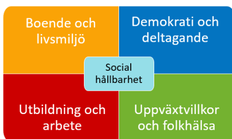
Figur 5. Målområden för social hållbarhet inom Upplands Väsby kommun.

Agenda 2030 relaterar väl till kommunal verksamhet och kommunala uppdrag då den handlar om en hållbar samhällsutveckling. Upplands Väsby kommun har under 2023 genomfört en kartläggning av arbete som kopplar till de globala målen. Kartläggningen identifierade inom vilka målområden kommunen i nuläget har mest verksamhet. Denna kännedom underlättar vid fördelningen av resurser på ett effektivt sätt samtidigt som de ska leda till en hållbar utveckling. Längst har kommunen kommit inom det ekonomiska perspektivet genom att ha en välskött ekonomi med goda resultat under ett antal år, en god soliditet och en relativt låg låneskuld. Dessutom har kommunen under lång tid genomfört riktade arbetsmarknadsinsatser med syfte på kommuninvånarens sysselsättning och egenförsörjning. Inom det ekologiska perspektivet upprätthåller kommunen sedan länge en ISO 14001-certifiering, vilket har skapat ett strukturerat arbete med kontinuerlig uppföljning. Detta är i sin tur en förutsättning för ett långsiktigt miljöarbete för att bland annat kunna möta utmaningar som de pågående klimatförändringarna ger. En pågående satsning inom det sociala perspektivet kommer att medföra ett kompletterande tillskott för kommunens hållbarhetsarbete. Genom att definiera social hållbarhet inom ett antal målområden som ligger nära det kommunala uppdraget, synliggörs ytterligare behov och insatser som behöver genomföras för kommunens medborgare.