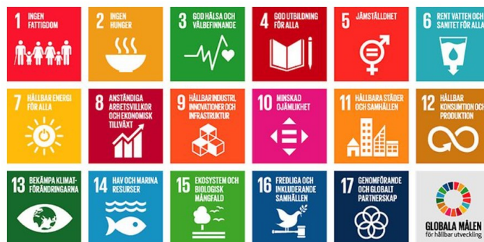
Figur 4. FN:s 17 globala mål i Agenda 2030.

Agenda 2030 relaterar väl till kommunal verksamhet och kommunala uppdrag då den handlar om en hållbar samhällsutveckling. Upplands Väsby kommun har under 2023 genomfört en kartläggning av arbete som kopplar till de globala målen. Kartläggningen identifierade inom vilka målområden kommunen i nuläget har mest verksamhet. Denna kännedom underlättar vid fördelningen av resurser på ett effektivt sätt samtidigt som de ska leda till en hållbar utveckling. Längst har kommunen kommit inom det ekonomiska perspektivet genom att ha en välskött ekonomi med goda resultat under ett antal år, en god soliditet och en relativt låg låneskuld. Dessutom har kommunen under lång tid genomfört riktade arbetsmarknadsinsatser med syfte på kommuninvånarens sysselsättning och egenförsörjning. Inom det ekologiska perspektivet upprätthåller kommunen sedan länge en ISO 14001-certifiering, vilket har skapat ett strukturerat arbete med kontinuerlig uppföljning. Detta är i sin tur en förutsättning för ett långsiktigt miljöarbete för att bland annat kunna möta utmaningar som de pågående klimatförändringarna ger. En pågående satsning inom det sociala perspektivet kommer att medföra ett kompletterande tillskott för kommunens hållbarhetsarbete. Genom att definiera social hållbarhet inom ett antal målområden som ligger nära det kommunala uppdraget, synliggörs ytterligare behov och insatser som behöver genomföras för kommunens medborgare.