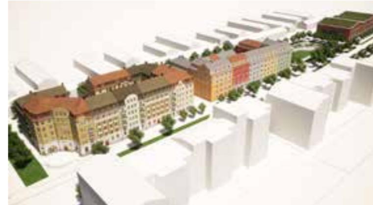
Perspektivbild över hela planområdet.