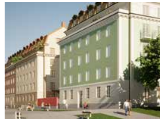
Bild över kvarter 1 sett från den planerade gatan norr om bebyggelsen.