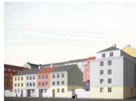
Bild över kvarter 2 sett från den planerade gatan norr om bebyggelsen.