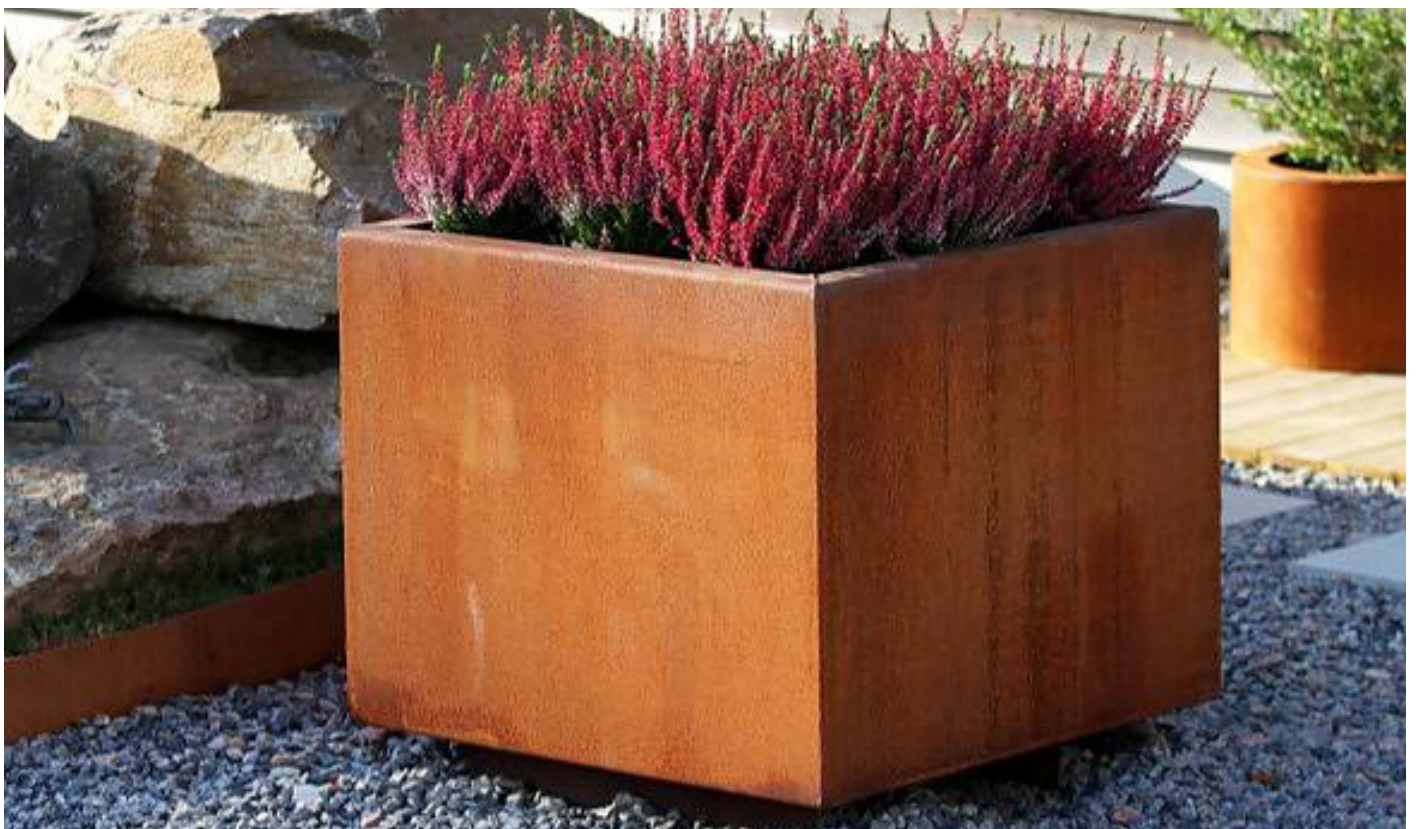
Urnan finns i Blå parken.